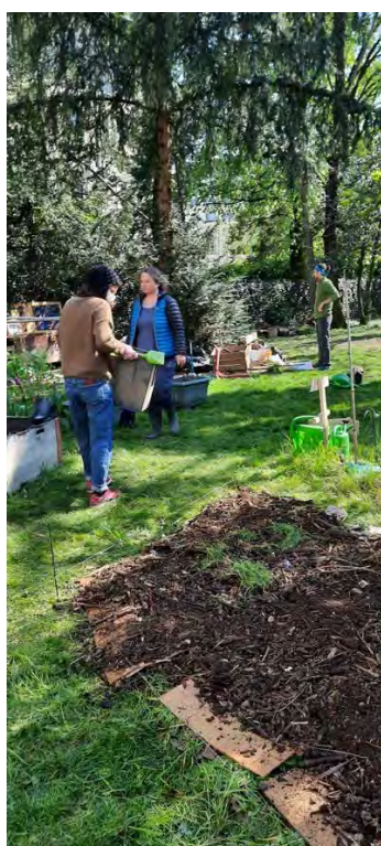
Notre chère faucheuse d'herbes préférée

C'est parti pour un chantier où tous donnent de l'intérêt à inventer et participer à l'émulation de cette expérience partagée entre toutes les générations.