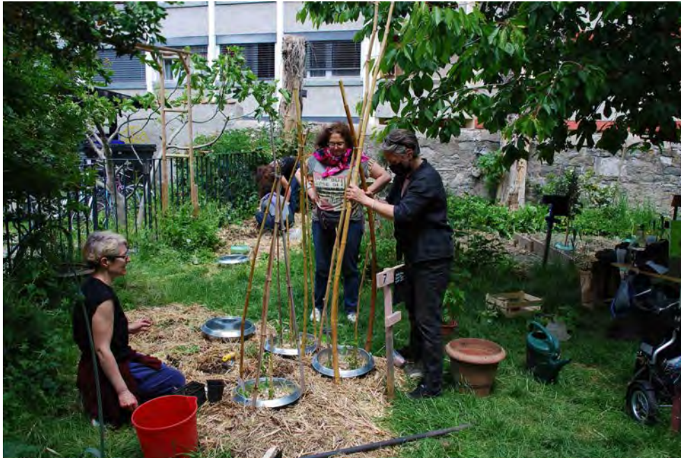
Pendant que certaines plantes un jour d'autre plantent aussi mais dans la rue