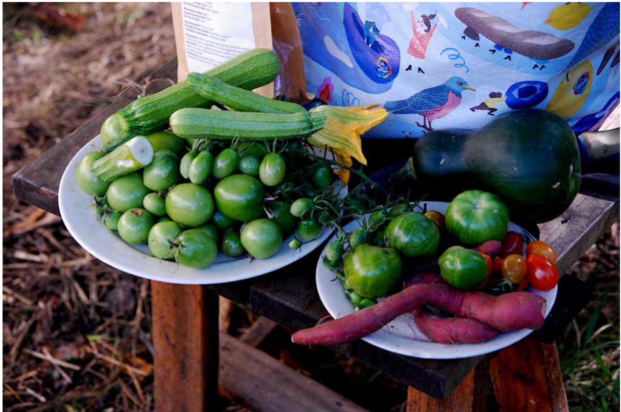
Les cadeaux de l'esprit du jardin de cette année 2021. Nous avons eu le plaisir d'avoir moult tomates malgré la pluie et le mildiou et d'adorables mini concombres prénommés Melothrie scabre ( Cucubataées Melothria pendula scabra ) délicieux !