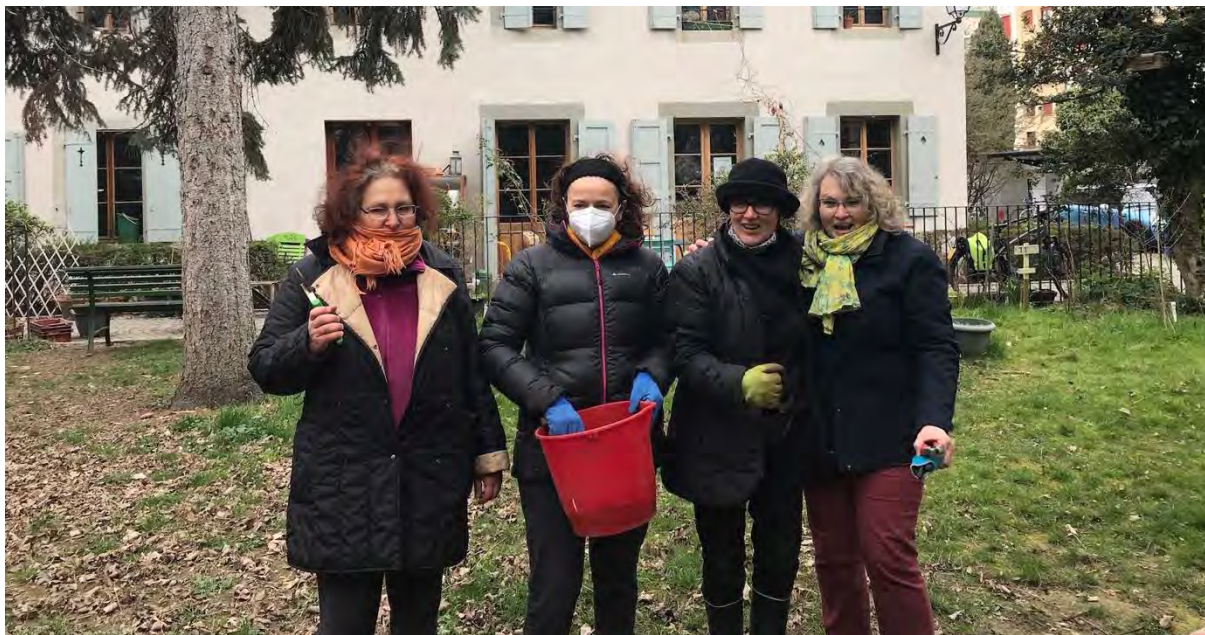
4 grâces et compost

Épinards et salades poussent, un nouveau venu félin travaille avec élan pour le tamisage du compost frais, le poste est géré environ deux fois par année. Une fois que le fond du compost frais est bien avancé (terreau), il est alors transféré dans la partie qui lui est dévolue. Et c'est alors le moment de le tamiser pour le mélanger avec les cultures que nous planterons prochainement ou que nous utiliserons pour les nouvelles parcelles.