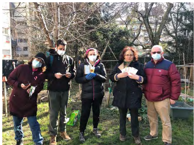
Le partage des graines